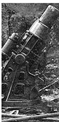
Particolare di un obice austriaco schierato sul fronte

■ La Prima Guerra Mondiale ha lasciato tracce indelebili nella storia dell'umanità e ha segnato in modo indimenticabile non solo l'animo dei soldati che l'hanno direttamente combattuta, ma anche quello della popolazione civile. I segni del conflitto si osservano a distanza di un secolo anche tra le pieghe morfologiche di molti territori: oltre alle trincee, ai camminamenti e alle postazioni sono numerose le aree, soprattutto di montagna, che accolgono ancora in modo evidente le testimonianze dei bombardamenti e dello scoppio di mine. Il recupero di questi siti può e deve contribuire in modo importante alla maturazione di una coscienza storica collettiva e personale, pertanto sono numerose le attività specifiche promosse da enti pubblici e associazioni, tra le quali sono in prima fila gli Alpini. Nell'ambito della provincia di Trento è stato avviato in questa direzione l'interessante progetto Vast, acronimo che significa Valorizzazione Storia e Territorio. Quando la regione del Trentino apparteneva all'impero Austro-Ungarico furono costruite in fasi successive, a di-